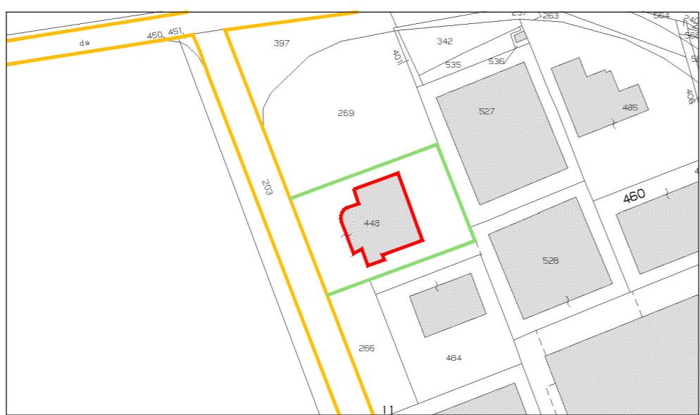
ESTRATTO MAPPA CATASTALE - Comune di Sandrigo - Fg.4 Mapp. 448

COMUNE DI SANDRIGO - PROVINCIA DI VICENZA S.C.I.A PER OPERE INTERNE RELATIVE AD UNA DIVERSA DISTRIBUZIONE DEL LABORATORIO